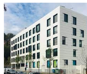
3 ème étage, aile B Rue Ferdinand Campus, 1 4000 LIEGE