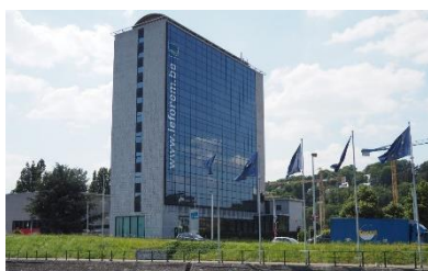
10 ème étage Quai Banning, 4 4000 LIEGE

Le 17 mai 2022, l'équipe de l'Instance bassin EFE de Liège a déménagé, mais reste sur le site du Val Benoit.